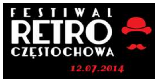
Częstochowa za zorganizowanie I Festiwalu Retro