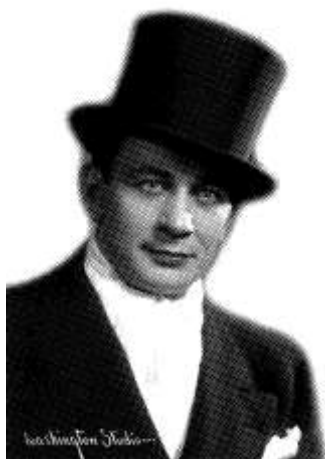
Mieczysław Fogg 1901-1990