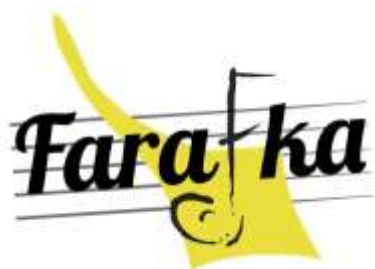
STUDIO PIOSENKI FARAFKA Śródmiejski Dom Kultury Kraków