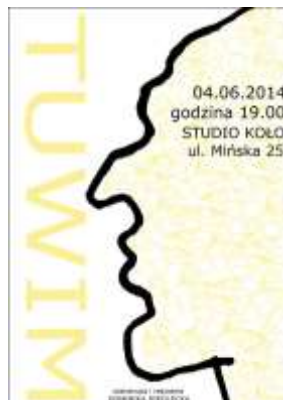
I SŁO Warszawa za spektakl muzyczny Piękne lata 20.

Spektakl muzyczno-kabaretowy z tekstami Juliana Tuwima w wykonaniu Studia Piosenki Domu Literatury